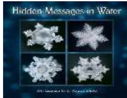
Gambar 2. Bentuk kristal air yang dibacakan kata-kata baik