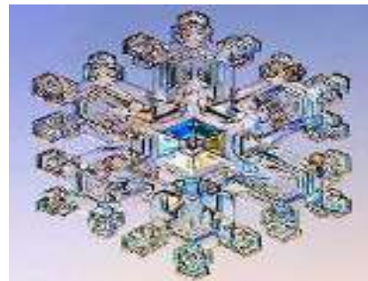
Gambar 4. Bentuk kristal air zam zam