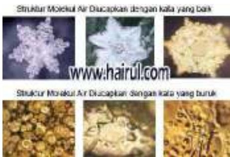
Gambar 3. Bentuk kristal air yang diucapkan kata-kata buruk